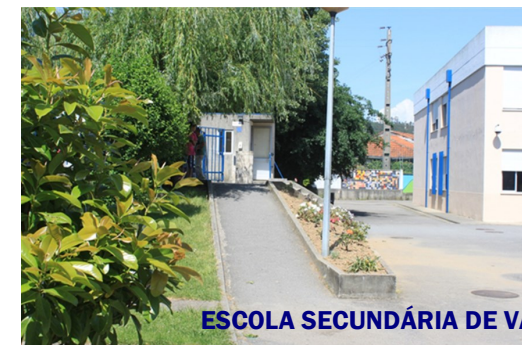
ESCOLA SECUNDÁRIA DE VALONGO